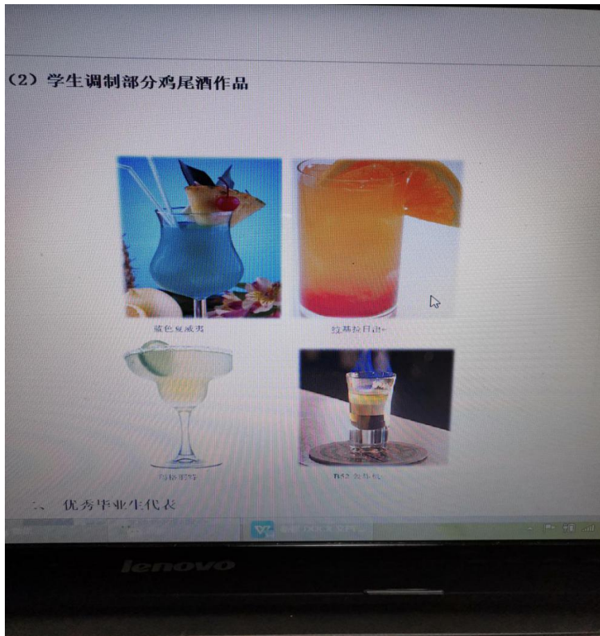
学生调制鸡尾酒部分作品