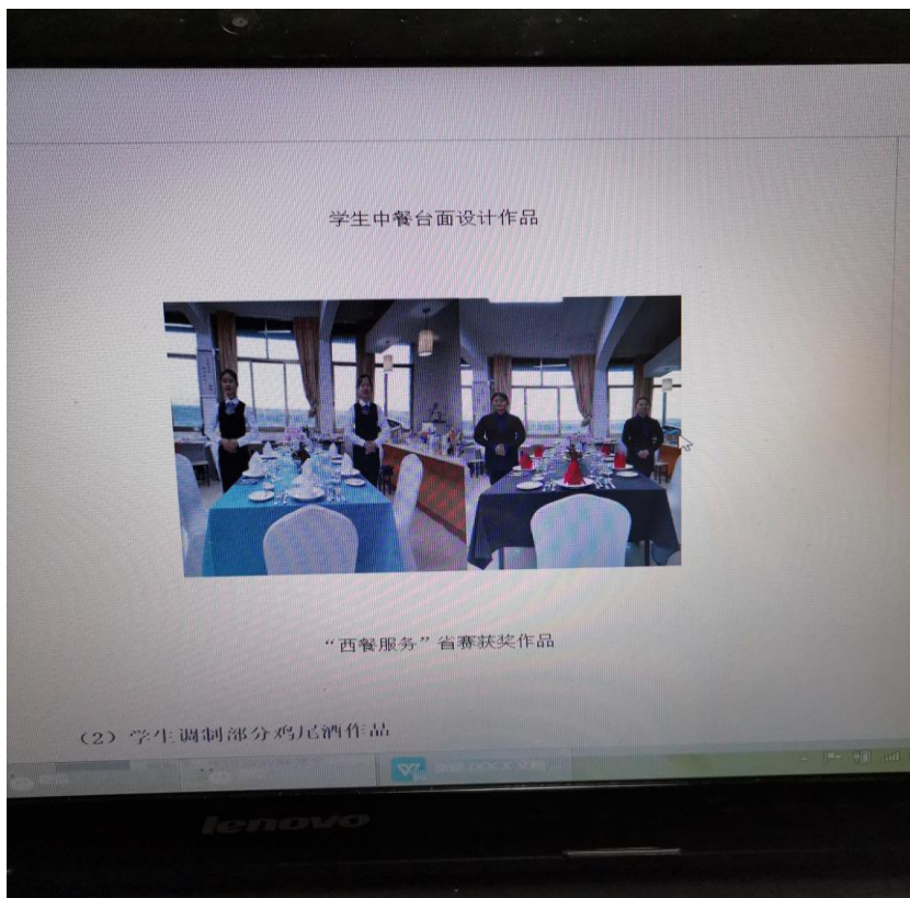
学生台面设计作品